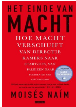
Het einde van macht (Naím, Moisés, 2015)