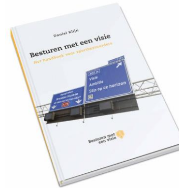
Besturen met een visie (Klijn, 2012)